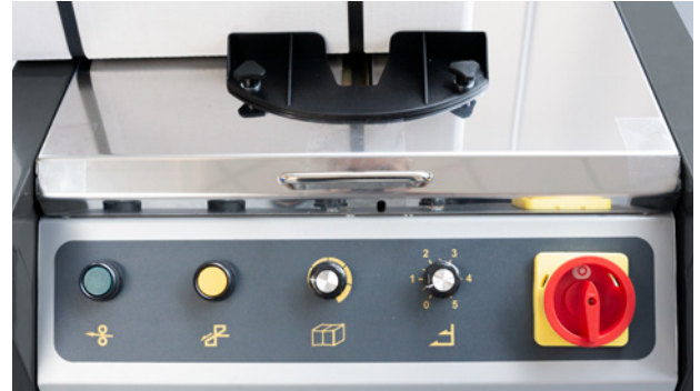
Übersichtliches, schräg angebrachtes Bedienfeld

Kompakte Maße für den platzsparenden Einsatz.