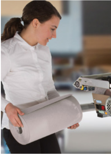
Verarbeitet ein- oder zweilagiges 100 % Recyclingpapier verschiedener Stärken