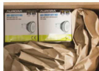
Papierrollen sparen wertvolle Lagerfläche - Polster haben bis zu 60-faches Volumen des Ausgangsmaterials