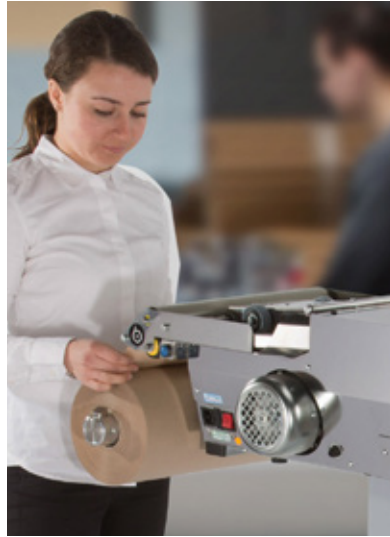
Die packmate™pro verbraucht 25 % weniger Papier